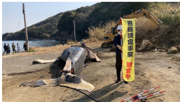
写真2. 3月8日 大月町竜ヶ迫に漂着したクジラの調査および埋却

本件に関する問い合わせは、 （一財）日本鯨類研究所 田村（090-3216-4594； yorikujira@i-cr.jp ） または、（一社）日本水族館協会 挟間（080-8831-4010）まで