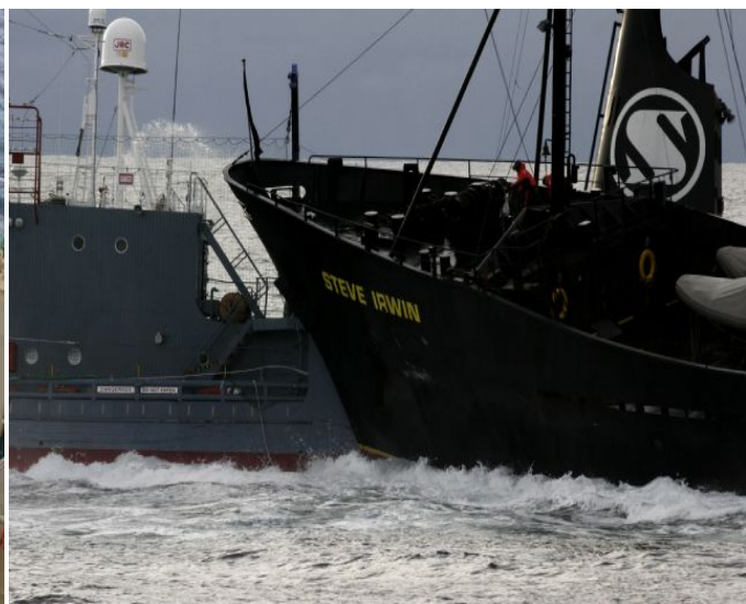
上写真:シーシェパード船「スティーブ・アーウィン」が第3勇新丸に衝突する瞬間の映像。