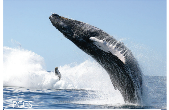
ダイナミックに跳躍するザトウクジラ（PCCS:プロビンスタウン沿岸調査センター）

鯨類（クジラやイルカ）は陸上に起源を持つ哺乳類で、およそ5000万年前にカバ類に近い祖先から分化し、今では地球上のあらゆる水域に進出し、一部は海洋生態系の頂点に位置するなどユニークな生物群として繁栄してきました。また、鯨類は世界各地で古くから生物資源としても利用され、とりわけ我が国では独自の鯨食文化が育まれてきました。一方、近年ではその利用を巡って激しい対立が続き、IWC国際捕鯨委員会では毎年のように激しい議論が繰り返されてきました。本講座では、鯨類はいかなる生物であるかを東京海洋大学が所蔵する標本群を用いてビジュアルに解説を行い、国内の専門研究者からその資源研究と資源管理の実態をわかりやすく講義いたします。また、捕鯨の歴史と持続的利用を巡る国際的議論をそれぞれ国内の第一人者から解説いたします。