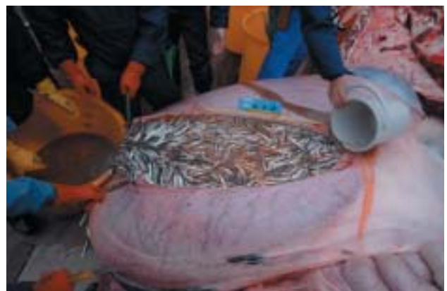
図5 . イワシクジラの第1胃からの胃内容物採集風景。