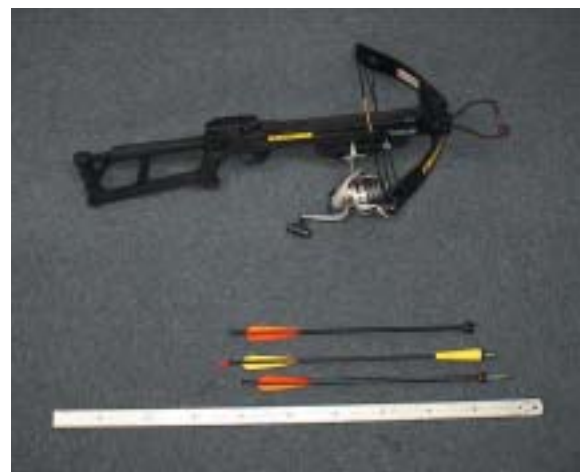
写真3 . 最新のリール付コンパウンドクロスボウ（上）と矢（下：先端部が採取器）。矢はフロート付（タモ網で回収）とリールで回収するタイプがあるが、現在は後者を使用している。

ICRシステムは、1989/90年度IDCRで産声をあげました。本システムによりクロミンククジラ4標本、シロナ