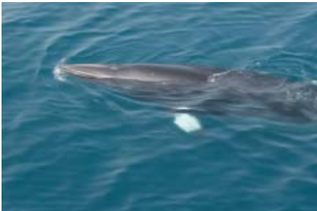
図3 . 2種の鯨種の判定方法。 (1) ミンククジラ...胸鰭基部の白斑域が特徴