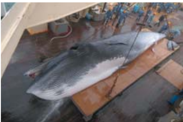
図4 . イワシクジラの体重測定風景。