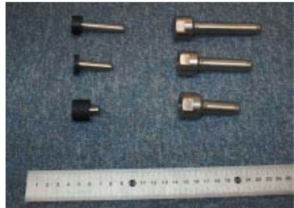
写真2 . 採取器の種類。右：エアーガンシステムの採取器。左：コンパウンドクロスボウシステムの採取器。

クロスボウでは、鏃（ヤジリ）の代わりに採取器が取り付けられています。採取器の大きさや形状は矢の直進性と空気抵抗を基に、小型軽量になっています。採取量は多くても1g程度です。1990年のシステム開発当初、IWC科学小委員会鯨類資源遺伝解析作業部会は、採取量を5g程度必要であることを提案していました。実際にはそれより少ない量で解析されていたと思いますが、採取量をできるだけ多くできるように、弾体と採取器の形状や大きさが設定され、弾体はアルミニウムとジュラコン（収縮性の少ない白色樹脂：写真1）、採取器はステンレス製（写真2）でした。これは捕鯨銃とは姿や形も異なっていますが、発射された採取器と弾体の弾道がロープを引っ張った状態で安定するように重心位置を設計しました。口径40mmのジュラコンリングは弾体部分にはめ込まれています。これは銃口にきっちり嵌め込まれるだけではなく、鯨体への喰い込みを避けるためです。また、ナイロンやプラスチックを用いないのは、温度差が激しい野外における機器の膨張や収縮による動作不良を避けるためでした。