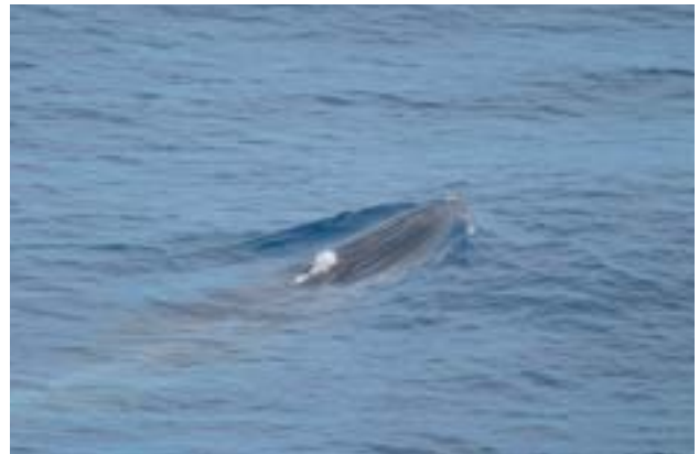
(2) ニタリクジラ...頭部の3本のリッジが特徴