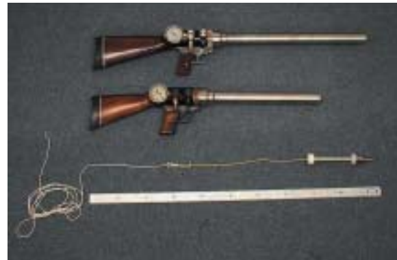
写真1 . エアーガンシステム機材。ICR銃（初期モデル：短銃身（下）、最新モデル：長銃身（上））とロープ付の弾体と採取器（先端部が採取器）。

株式会社（現：株式会社ミロク精機製作所）です。同社は既に日本各地で火災や水難救助活動に汎用されているミロクラインシューターM-63（M-63）という救急用筋索発射銃（空気銃）を開発していました。銃火器の規制が緩い諸外国では、筋索発射銃は火薬を用いていますが、日本では火薬に依存することができないデメリットがメリットになり、エアーガンを用いた発射システム（以下ICRシステム）の開発が進められました。重量のあるものにロープをつけて威力を減少させないで射程距離を確保するのは、銃火器のコンセプトからは逸脱していましたが、本システムのデザインコンセプトは「捕鯨銃によるバイオブシー」であり、捕鯨銃の弾道や平頭銃の貫通性能を検討し、空気銃の形体（主に銃身長と口径）から300gの弾体に径3mm程度のロープをつけて、毎秒70mないし80mで約100mまで直進する発射性能を得るというものでした。その結果、初期モデルは弾体の形体と重量及び発射の際の衝撃を考慮し、全長840mm、銃身長450mm、銃口径45mmの仕様になりました（写真1）。