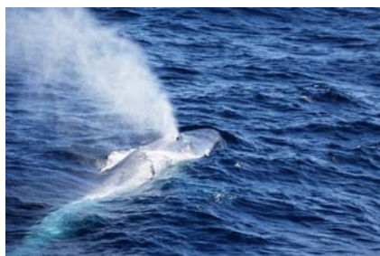
写真 1. シロナガスクジラ