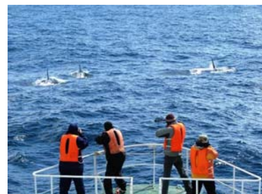
写真 2. バイオプシーサンプル採取中のシャチ