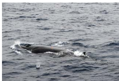
写真 2. バイオプシーサンプル採取中のイワシクジラ