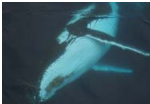
調査船に寄って来たザトウクジラ

本年の調査においても、ミンククジラが最も発見が多く、発見総数は1,711群4,400頭でした。ミンククジラが優占種であることは、18年間のJARPAを通して一貫した結果です。しかしながら、発見される鯨種組成には、年変化が認められ、JARPAの初期の調査では、ミンククジラに次いで、ハクジラ類のマッコウクジラやシャチの発見が多かったのに対して、最近の調査では、ザトウクジラやナガスクジラなどのヒゲクジラ類が比較的多く発見されるようになり、現在ではミンククジラが発見の数では勝っているものの、生物量(バイオマス)で比較するとザトウクジラやナガスクジラがミンククジラに匹敵するような発見が得られるようになりました。