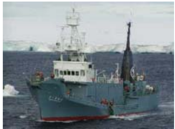
目視採集船 第二勇新丸