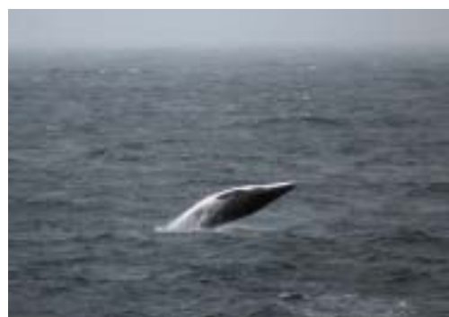
南極海ミンククジラのプリーチング