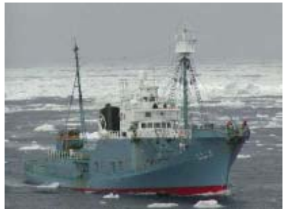
目視採集船 第一京丸