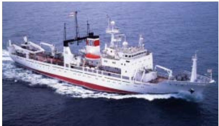
水産庁漁業調査船 開洋丸

調査対象としたロス海は、近年ではまれにみる広範な開氷域が形成され、開洋丸と連携してロス海を広く調査できたことにより、オキアミを鍵種とする南極海生態系の構造の解明並びに南極海的环境変動による鯨類及びオキアミ資源への影響の把握に必要な貴重な資料を収集できたと確信しています。