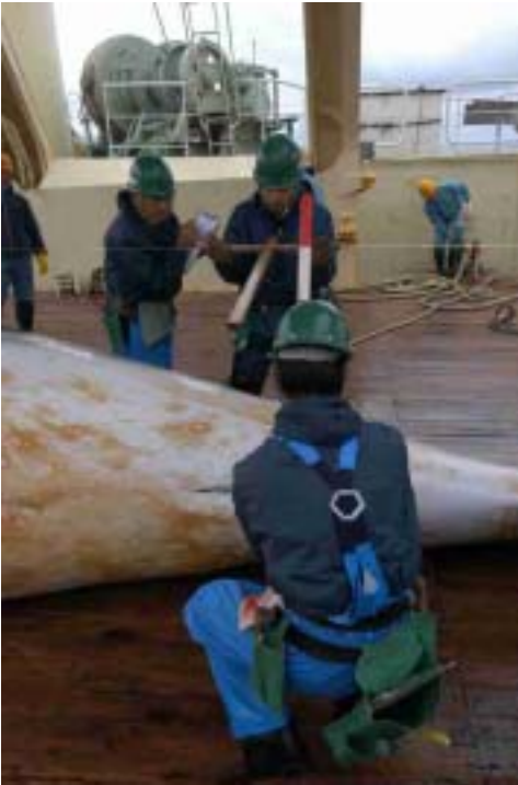
調査母船で鯨体を計測する生物調査員

採集された南極海ミンククジラの標本は、調査海域における年齢や性別の組成や棲み分け及び自然死亡率等を調べるために用いられるほか、形態・成長・繁殖・生理・回遊に加え、生態系及び海洋環境といった多岐にわたる研究項目について解析するために有効に活用されております。