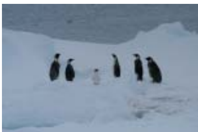
氷上のアデリーペンギン (中央)とコウテイペンギン

またこの往復航海中には、南極海ミンククジラの回遊と繁殖海域における分布及び系統群判別に必要な情報を得ることを目的にして、南半球中低緯度鯨類目視調査を実施しました。