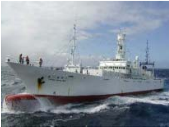
目視専門船 第二共新丸