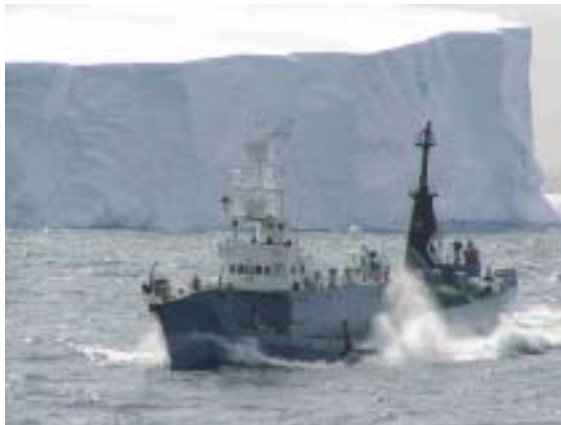
目視採集船 勇新丸